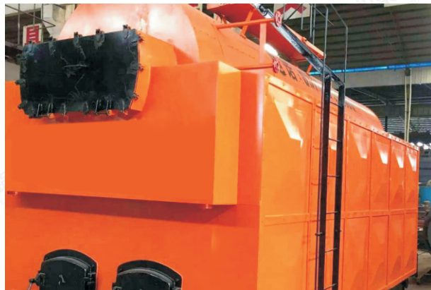
2015.9-8吨 DZH8-1.25-T 江苏南京桌派酿酒有限公司