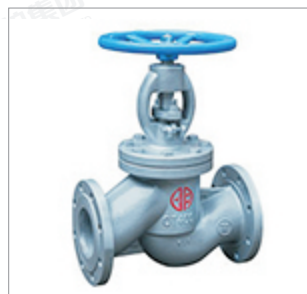
郑州宇明球墨铸铁 截止阀