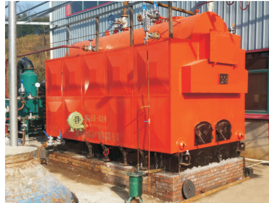
2014.9-6吨 DZH4.2-1.0/115/70-T 新疆华子矿业有限公司