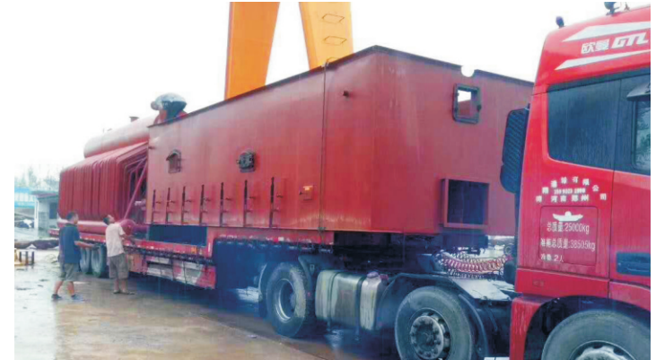
2014.7-10吨 DZH7-1.0/115/70-T 北京-中交路桥北方工程有限公司