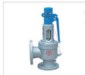
郑州明宇球墨铸铁 弹簧全启式安全阀