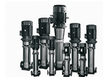
浙江利欧不锈钢水泵