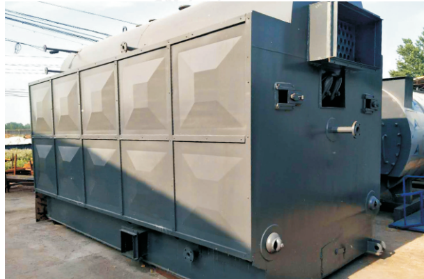
2016.7-4吨 DZH2.8-1.0/115/70-T 内蒙古远和国际贸易有限公司