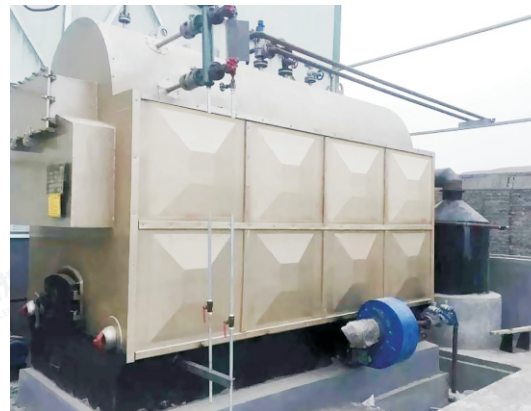
2015.4-1吨 CDZH0.7-85/60-T 湖北咸宁东启包装