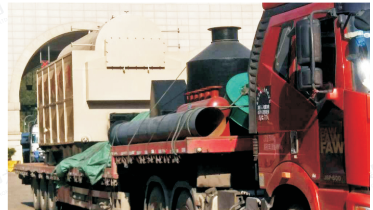
2015.4-4吨 DZH4-1.25-T 河南洛阳市洛达特机械设备有限公司